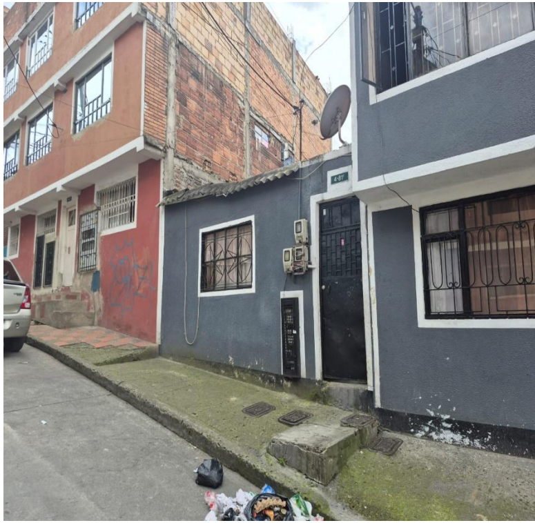
IMAGEN 3: FACHADA LATERAL