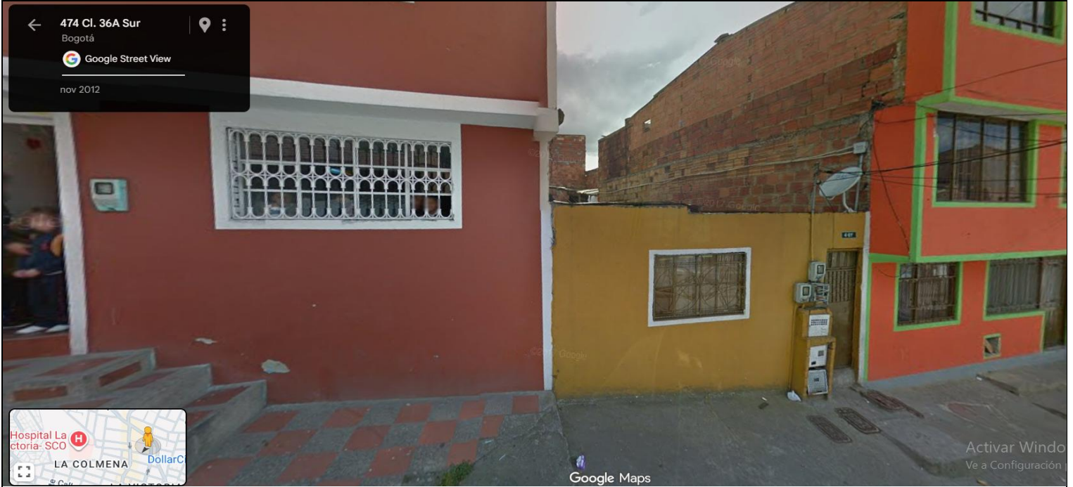
IMAGEN 1: NOMENCLATURA